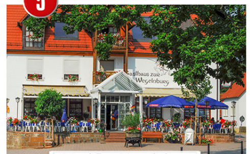
Hotel Zur Wegelnburg

Hauptstraße 15 · D-76891 Nothweiler Tel. 0049 (0) 6394 920 9190 www.zur-wegelnburg.de